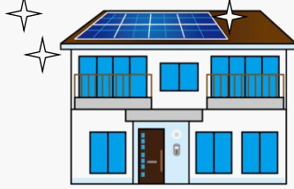
太陽光発電・蓄電池の設置に