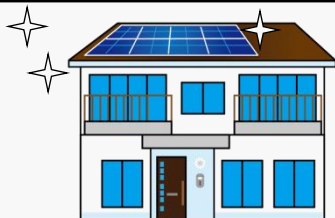
太陽光発電・蓄電池の設置に