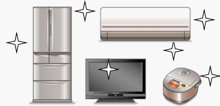
家電機器の購入に