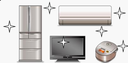
家電機器の購入に